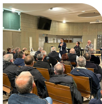
Rencontre avec les militants et élus à Narbonne avec Eric Andrieu.