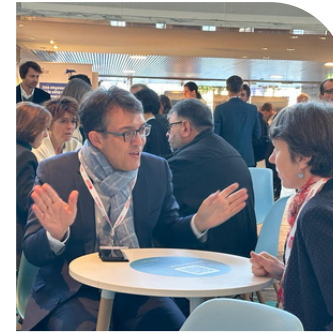
Échanges lors des assises de la mer à Nantes.