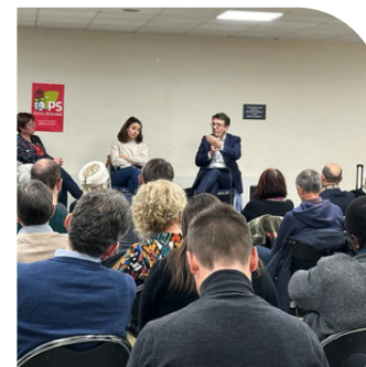
Réunion publique Europe sur la montée de l'extrême droite à Angers