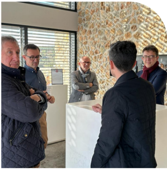
Rencontre avec des vignerons indépendants en région Occitanie.