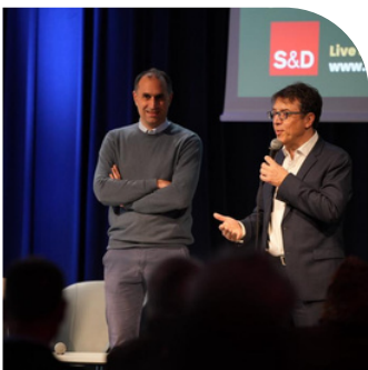
Conférence des socialistes et démocrates européens sur l'avenir des politiques agricoles et alimentaires à Nantes.