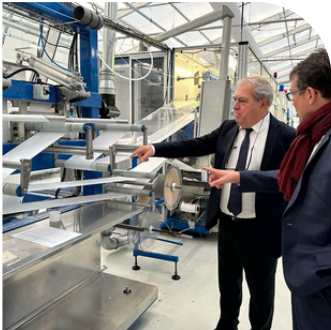
Visite de l'entreprise Paul Boyé Technologies à Labarthe-sur-Léze.