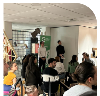
Réunion avec les Jeunes Européens à Toulouse le 15 novembre 2023