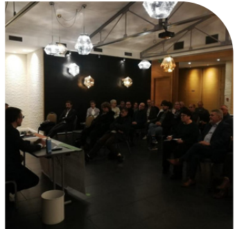
Réunion publique à Reims