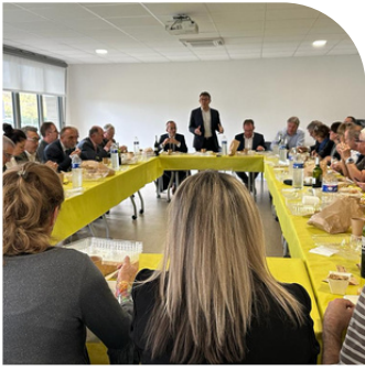
Échanges avec des élus à Portet-sur-Garonne.