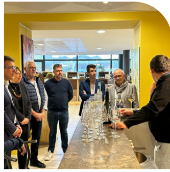
Rencontre avec des vignerons coopérateurs dans la région Occitanie.