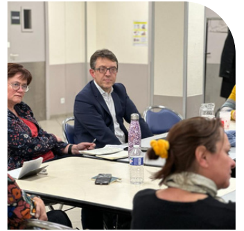
Rencontre avec une association de réfugiés à Angers.